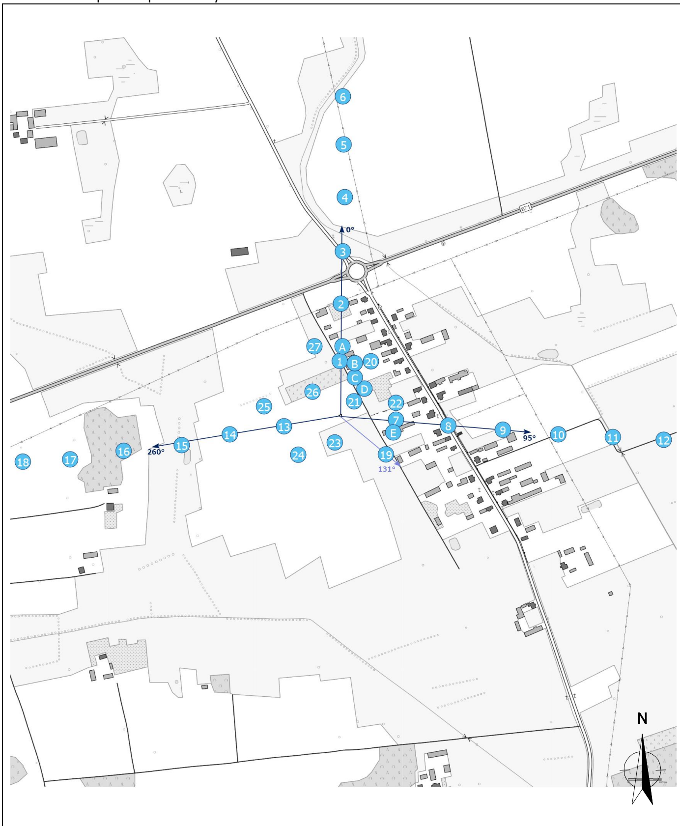
Załącznik 2. Widok pionów pomiarowych