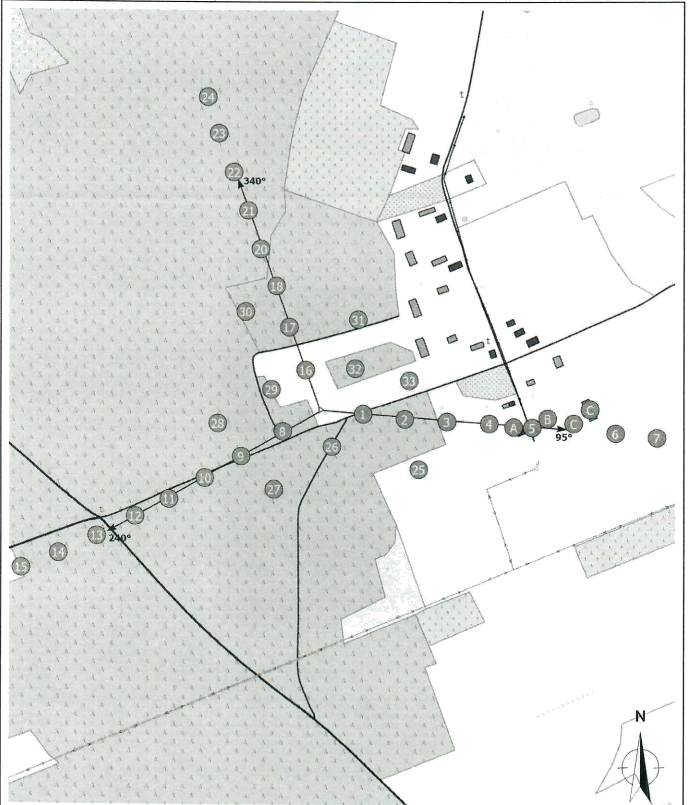
Zał. 2. Widok pionów pomiarowych