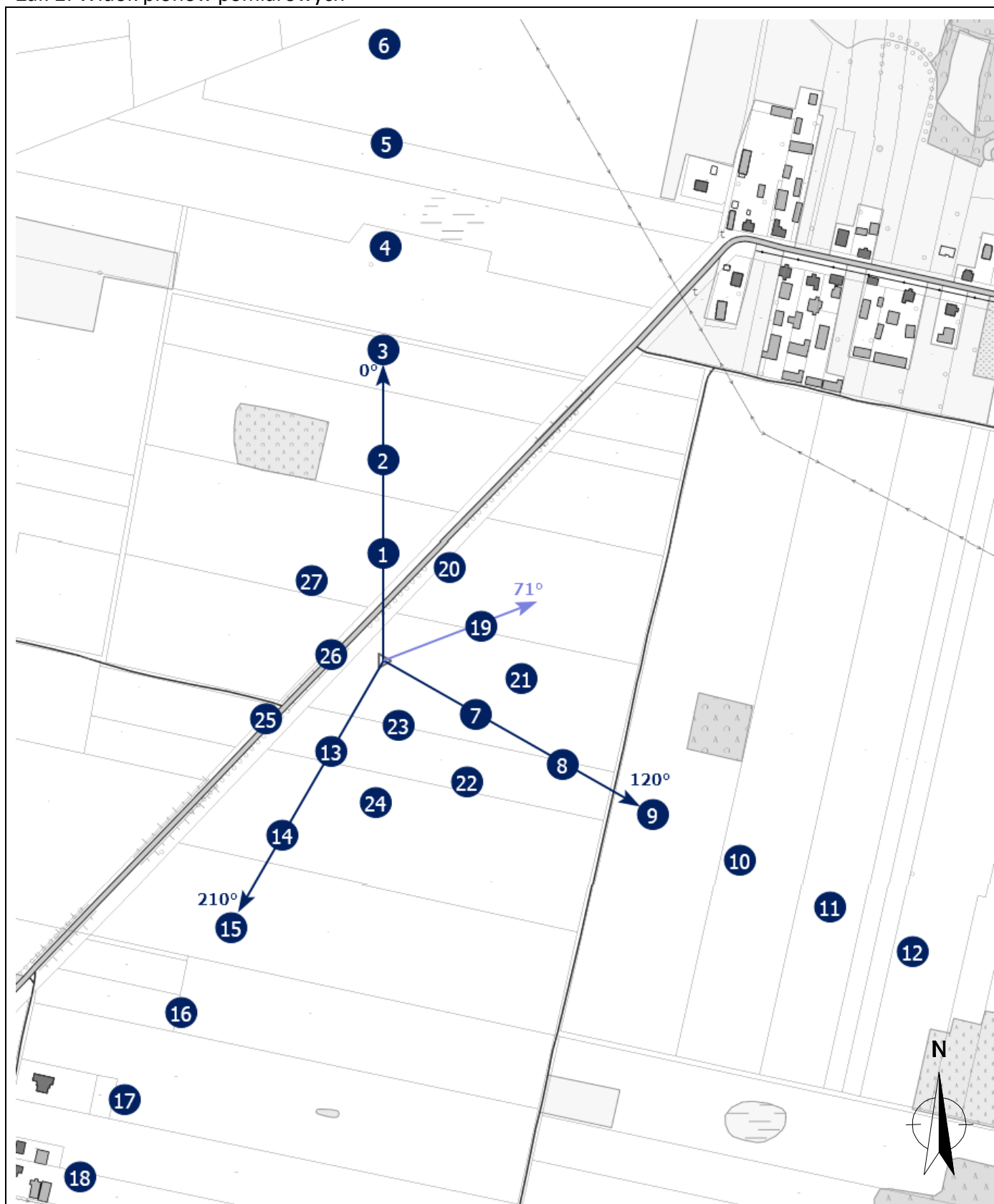
Załącznik 2. Widok pionów pomiarowych