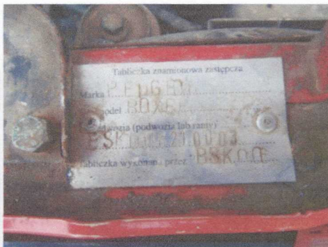
Zastępcza tabliczka znamionowa