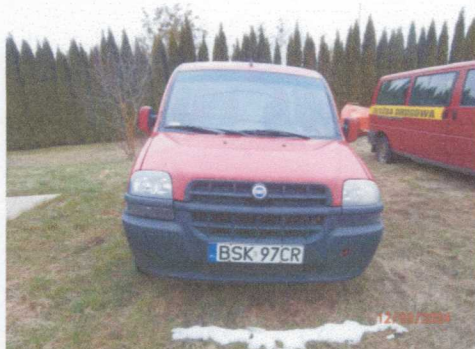
Ogólny widok pojazdu

Rodzaj pojazdu: Samochód ciężarowy (na bazie osobowego)