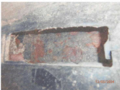
Skorodowane pole numerowe