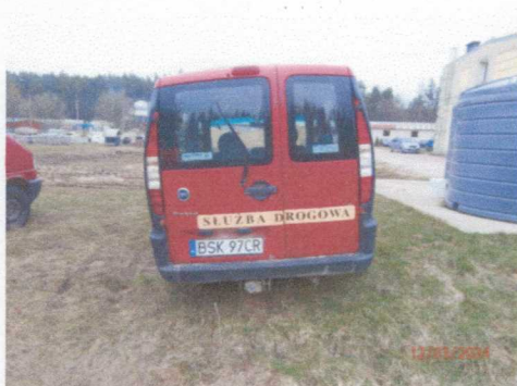
Ogólny widok pojazdu