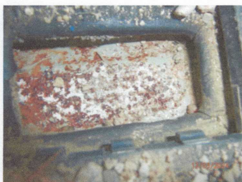
Skorodowane pole numerowe