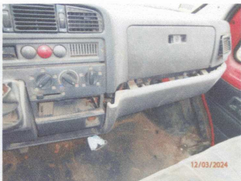
Zniszczone poszycie deski rozdzielczej