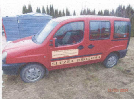
Ogólny widok pojazdu