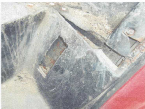
Zniszczone poszycie kabiny