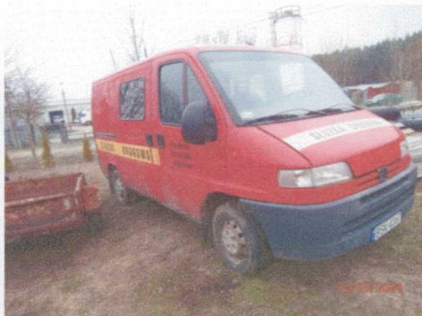
Ogólny widok pojazdu