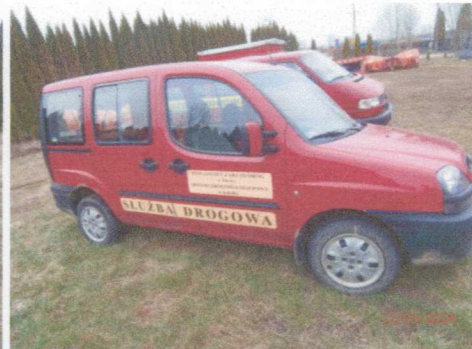
Ogólny widok pojazdu