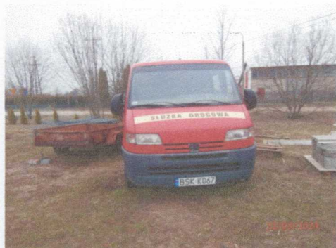
Ogólny widok pojazdu

Rodzaj pojazdu: Samochód ciężarowy do 3.5t