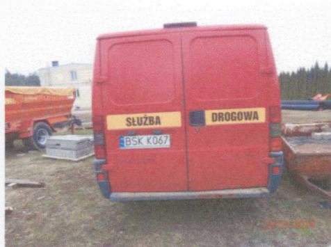
Ogólny widok pojazdu