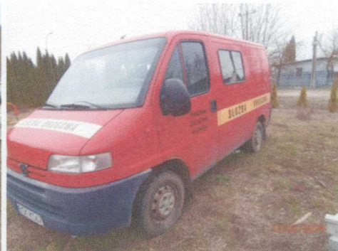
Ogólny widok pojazdu